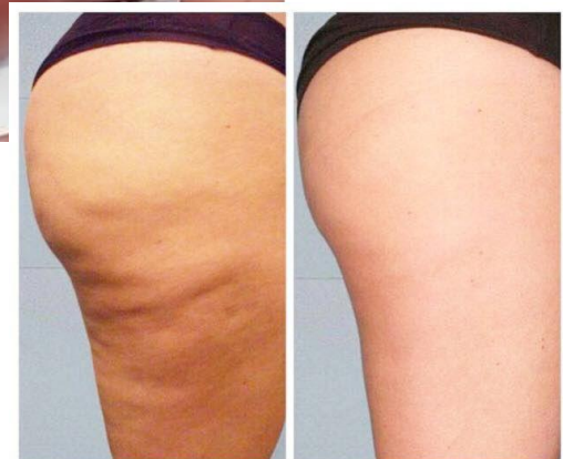
5 TRAITEMENTS KUMA SHAPE