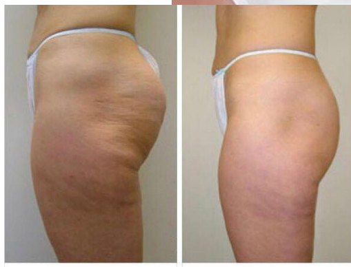
7 TRAITEMENTS KUMA SHAPE